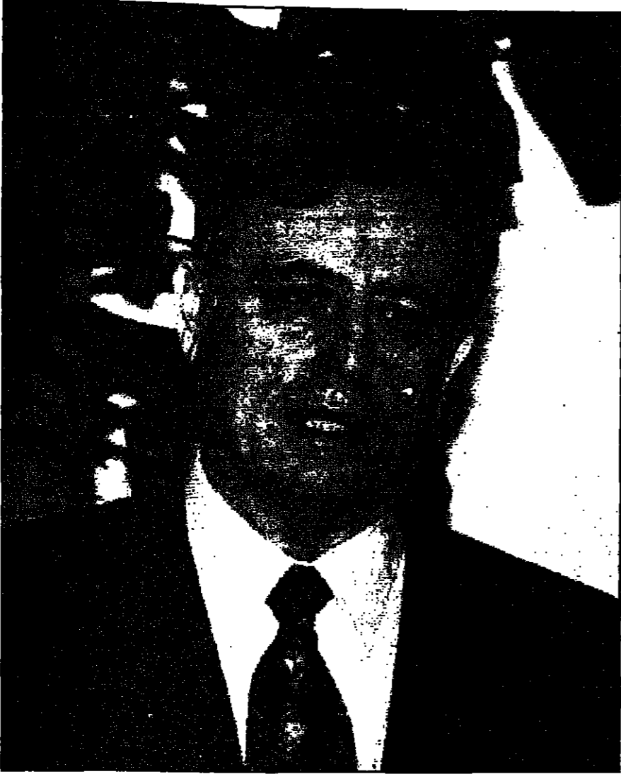
عبد الحليم خدام

للصحف التي باتت الاكثر تحيزا، وبمروسة مقصودة، عن السياسة السورية، تكاد تتحدث يوميا من الجانب الاسرائيلي في المؤسسة التركية الذي يصعد اجواء اللوحة مع العرب وسورية بالذات... وحول الموضوع حرة او حرة في وزارة الاعلام السورية على ترتيب زيارات الصحافيين الزائرين الى القنصلية حتى يروا وجوه الدمار التي خلفها الاسرائيليون في المدينة قبل انسحابهم، فلما جرحهم ايضا على التأكيد عليه، بان الجولان ليست هضبة جرداء، وانما مساحة كبيرة من الأراضي الخصبة تزيد مساحتها من 1860 كيلومترا مربعا.